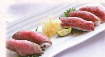
米沢牛にぎり寿司の盛合せ