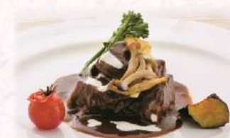
米沢牛のトロトロビーフシチュー